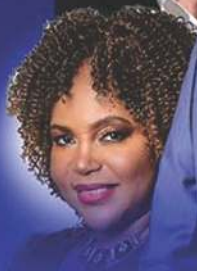
DR PEARL KUPE SOUTH AFRICA