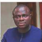
TUO ADAMA COTE D'IVOIRE