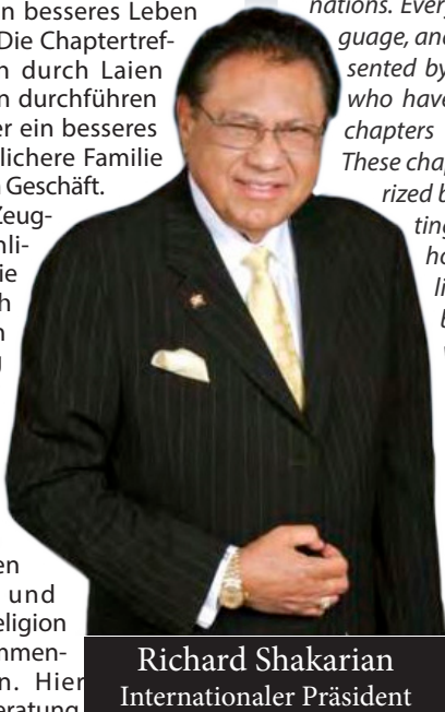
Richard Shakarian Internationaler Präsident

Es ist die Kraft der Zeugnisse von gewöhnlichen Menschen, die außergewöhnlich wurden, durch ihre Verbindung miteinander und der Kraft des Glaubens. Jetzt kennen Sie das Geheimnis, warum Menschen aus allen religiösen Hintergründen, und einige jener die Religion verachteten, zusammenkommen können. Hier finden wir Hilfe, Beratung, Ermutigung und Antworten auf die schwierigsten Fragen des Lebens. Wir laden Sie ein, mit uns zu kommen. Auch Sie können einer der „glücklichsten Menschen auf Erden“ werden. ■